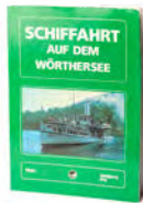
Buch „Schiffahrt auf dem Wörthersee“